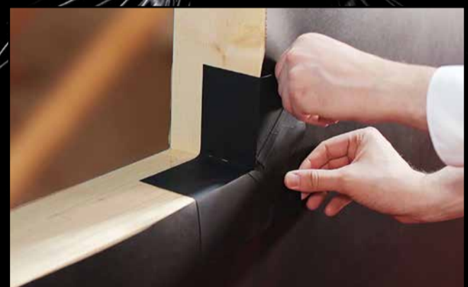
Neu im Sortiment: Selbstklebende Ecken für den Anschluss an Fassadenbahnen.

ter-Einbau, einfach, sicher und professionell mit unserem EckenDICHT-FassadenDICHT abgedichtet werden. Erhältlich als Innen- und Außenecken, sowie als System-Anschlussband.