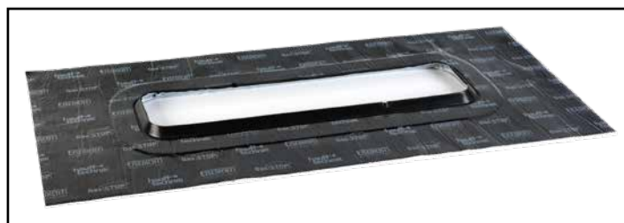
Abdichtungsmanschette für Hauff-Mehrsparten-Hauseinführungen

bis Vierfachdurchdringungen (R4) an. Der Aufbau ist ganz ähnlich der MehrspartenDICHT alten Modells: Das Formteil ist aus dem dauerbeständigem und flexiblem EPDM, welches komplettiert wird mit einem Alu-Butyl Klebekragen, der Feuchtigkeitsbeständigkeit, Rundheit sowie eine dauerhafte Luftdichtigkeit garantiert.