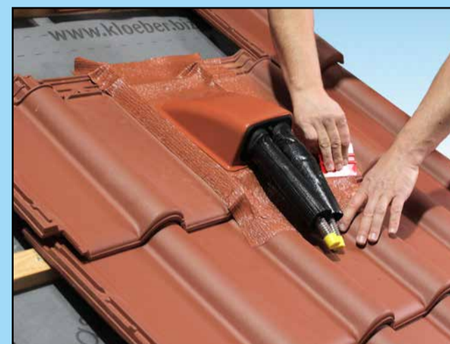
Die EISEDICHT®-AufdachDICHT Solar wurde in vielen Bereichen weiterentwickelt um noch mehr Anforderungen gerecht zu werden.

noch stabiler gegen jegliche Witterungen. Wir bieten Ihnen drei verschiedenen Ausführungen: Doppel-Solarrohr, Einzel-Solarrohr und Mehrfach-Kabeldurchführung. Die Durchführungen jetzt auch mit Tüllen ausgestattet, um eine einfache, sichere und dichte Anwendung zu gewährleisten. Sie lässt sich hervorragend kombinieren mit weiteren Manschetten aus dem Sortiment.