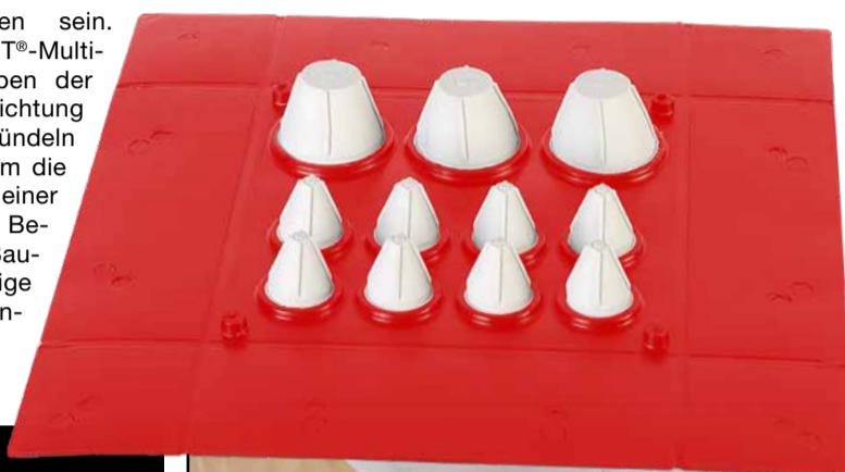
Die Einsatzmöglichkeiten sind sehr vielseitig.

leicht einzubauen sein. Das EISEDICHT®-Multi-board bietet neben der einfachen Abdichtung von Leitungsbündeln auf engstem Raum die Möglichkeiten einer mechanischen Befestigung am Baukörper, um etwaige Zugkräfte aufzufangen.